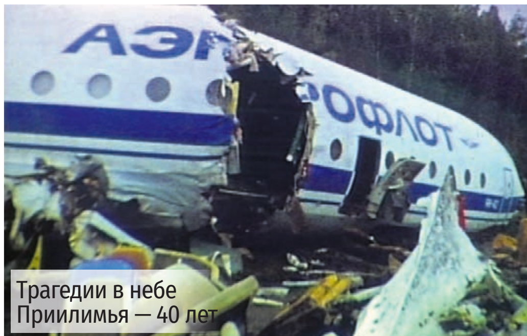
Трагедии в небе Приилимья — 40 лет

Шанс избежать катастрофы — был! Было даже два шанса в ту самую последнюю минуту перед столкновением! Как следует из записи переговоров экипажей всех четырёх воздушных судов, в 12:11:52 (за 1 минуту и 8 секунд до столкновения) экипаж борта 87455, «находясь